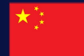
Китайская Народная Республика